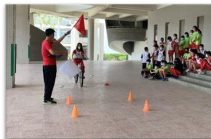
鐵人選拔賽:道路騎乘測驗