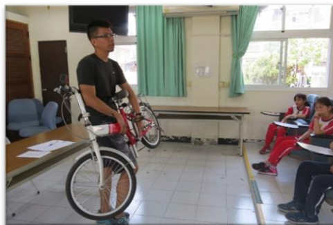
教師講解自行車構造、功能