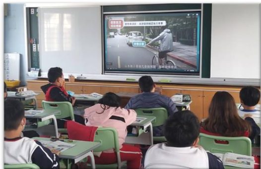
學生專心觀賞交通安全影片