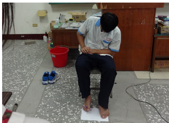
讓學生體驗用腳寫名字