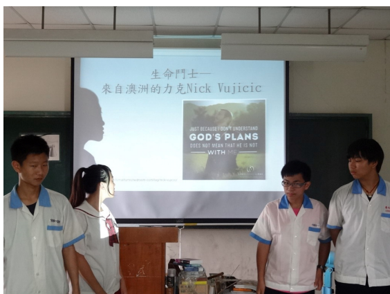
學生分組報告力克·胡哲