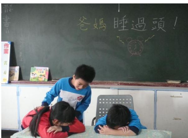
情境劇~爸媽睡過頭