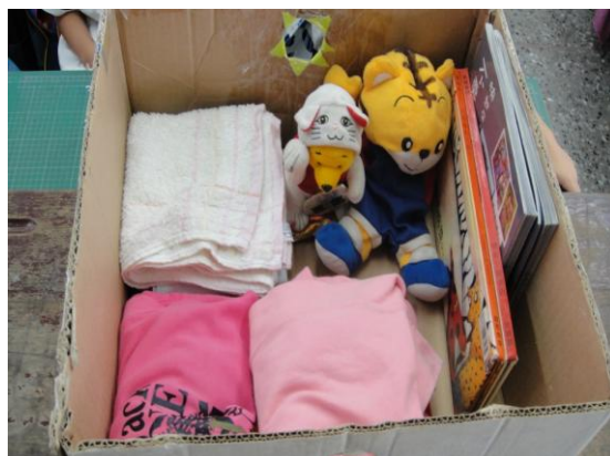
整理高手~整理後整齊模樣