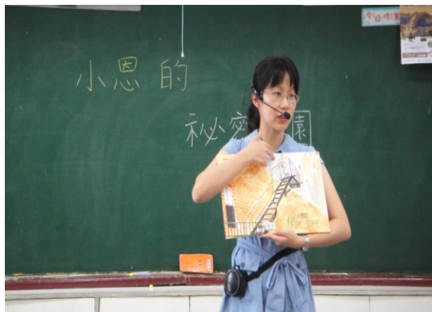
老師講述繪本內容