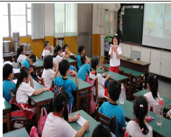
學生專注地聽故事