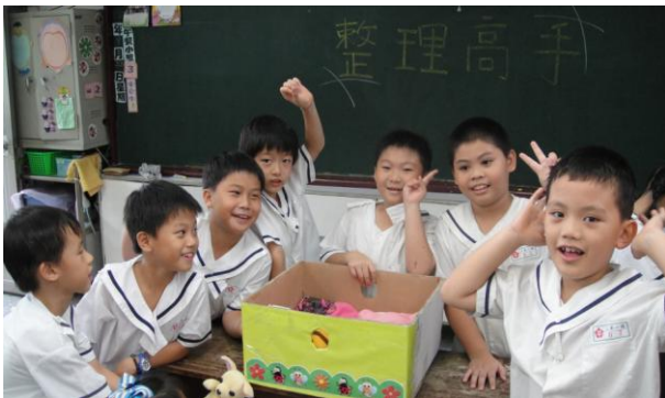
整理工作不分男女