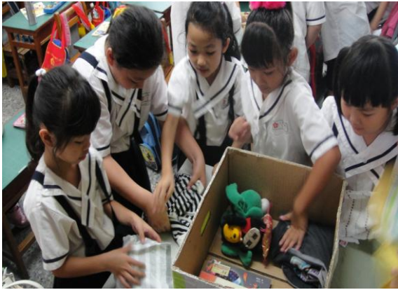
分工合作整理物品