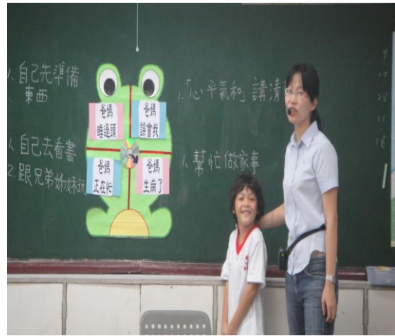
請學生上台發表意見