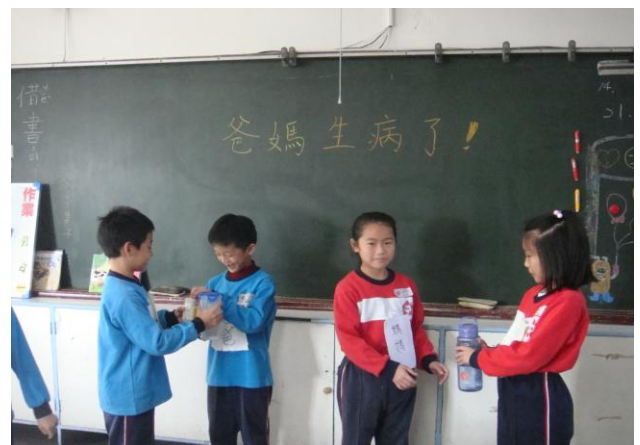
情境劇~爸媽生病了