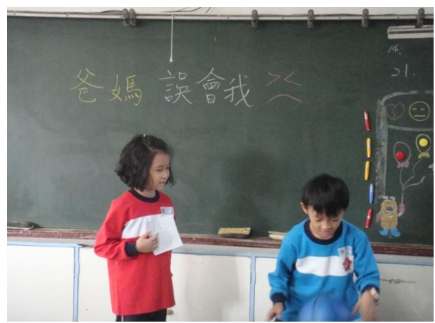
情境劇~爸媽誤會我