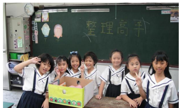
生活中運用到的能力