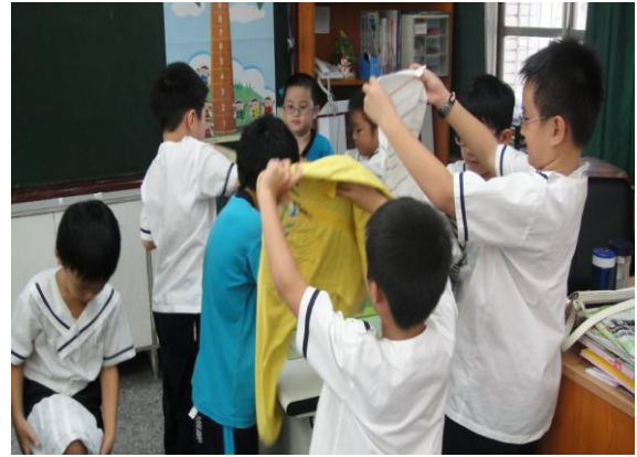
大家都要動手整理