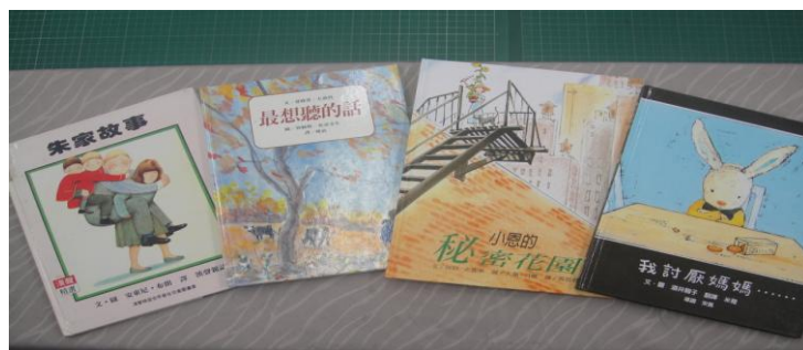
與主題相關的繪本