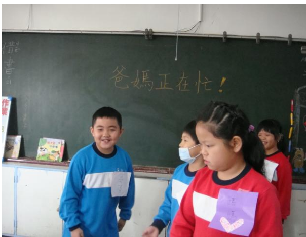
情境劇~爸媽正在忙