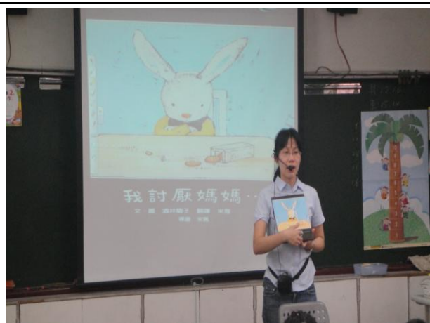
老師事先製作繪本 PPT